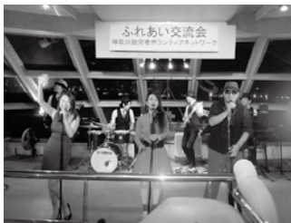
盛り上がる「生演奏」