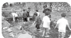
大きなマスを捕るぞー