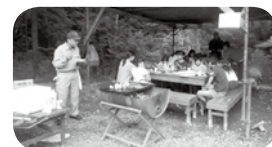
みんなで食べると美味しいね!

その他、参加団体さまの協力を得て、お楽しみ大抽選会も実施し大人から子どもまで楽しめる一日となりました。また、今年も地域福祉活動の一環として2か所から福祉施設の子どもを招待し、他の参加者と共に交流を深め楽しんで頂くことができました。