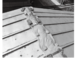
被害を受けた屋根

台風15号の対応については、過去の風水害と比べても対応の動き出しが早く、組合員から「こんなに早く来てくれると思わなかった」と感謝の声をいただいております。多くの組合員の皆さまが、修理業者の手配が取れず不安な思いを抱く中、早期に対応できたことで安心の提供に繋がりました。