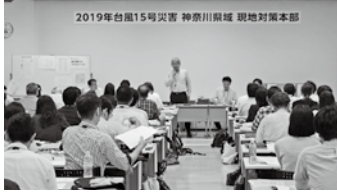
2019年台風15号災害 神奈川県 現地対策本部

2019年9月8日に上陸した台風15号、10月13日に上陸した台風19号は神奈川県をはじめ、各地に大きな被害をもたらしました。被災受付連絡は、台風15号については神奈川県では、7,715件、全国では30,241件、台風19号については神奈川県では3,333件、全国では14,822件を超える被害となっております。(10月29日現在)。神奈川県推進本部では迅速な被災者対応を行うため、新横浜と海老名に調査対応拠点を設置し、被災された組合員へのお見舞い活動(被害確認活動)をすすめております。