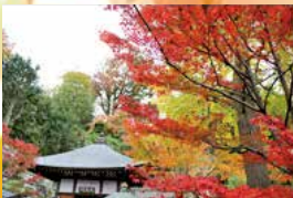
紅葉に染まる経蔵(輪蔵)