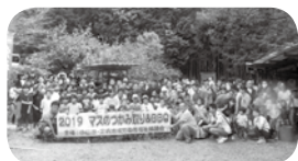
写真撮りまーす「全員集合」

元気いっぱい魚を追いかけ、自分で捕まえた魚を保護者と一緒に美味しく、食べる姿もみることができました。