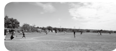
ナイスバッティング