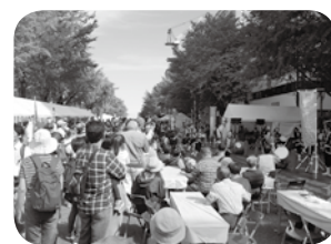
フェスタを楽しむ参加者

今年のテーマも「がんばろう東北!横浜から愛の風を!」としました。近年、自然災害が多発しており、今年も台風19号が東日本に甚大な被害をもたらしました。急遽、「台風19号災害支援募金箱」を8カ所に設置しカ