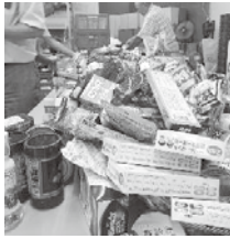
届けられた大量の食品

～提供先は、行政・社協等へ40団体、地域のフードバンク・子ども食堂など79団体にお届け～