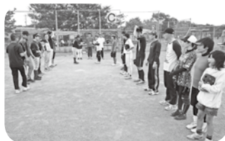
試合開始、主将あいさつ

9月28日(土)秋空の下、相模原地域連合と共催でソフトボール大会を開催しました。毎年恒例の本大会ですが、会場確保等の課題により、大変惜しまれながら