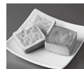
鳳梨酥 (パイナップルケーキ)