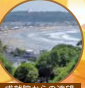
成就院からの遠望