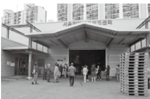
フードバンク前で集合写真

韓国フードバンク・フードマーケットは、1998年に貧困層に対する政府の救済策として誕生し、委託を受けた韓国福祉社会福祉協議会が全国的に展開しています。2015年には437カ所に達しました。特徴点は、政府主導の下で整備が行われ急速に発展し、寄託者や企業に多様な税制優遇や公的支援による持続的な運営が可能な体制となっています。