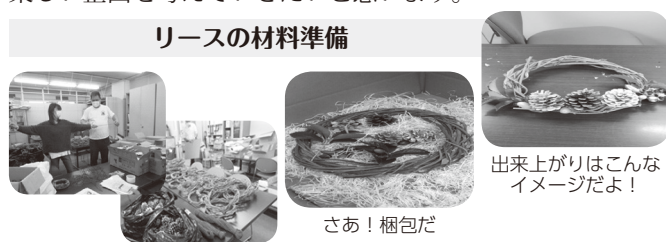
リースの材料準備

謝の声を沢山いただき達成感満杯のセミナーになりました。これからも、しばらく続くであろう「コロナ」に負けず、楽しい企画を考えていきたいと思ひます。