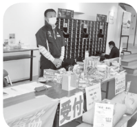
第24回スポーツ交流会

フードドライブで、179点・183* g が集まりました ～チャリティーゴルフを開催～