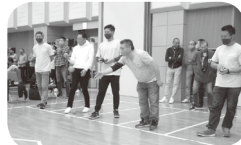
福祉チャリティーフェスタ2020

フードドライブで、179点・183* g が集まりました ～チャリティーゴルフを開催～