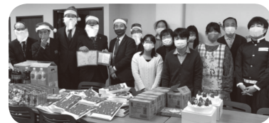
葉山幸保愛児園の職員・児童にケーキとお菓子など寄贈

今年は新型コロナの影響で、訪問人数をしばらく、プレゼント後の子どもたちと交流も中止したものの、各施設からは恒例の年末・年始の催しを子どもたちも楽しみにしていると、感謝の言葉を頂きました。