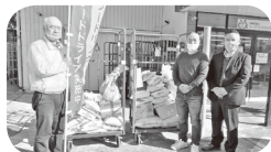
フードバンクに持ち込む県中央労福協の「お米」

労福協加盟の団体では、定期大会開催に合わせ組合員に「お米」の持参をお願いしたり、組合事務所に