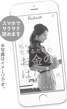
スマホでサクサク読めます