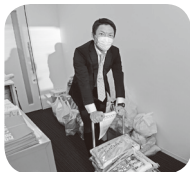
湘南労福協で集まった「お米」

神奈川県労福協と連合神奈川では、10月より「お米一合運動」を展開しています。各地域で「家庭から米一合を」合言葉に、労福協の定期総会や各種のイベント・会議などあらゆる場面を活用して運動を進めています。