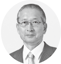
労働者福祉中央協議会 会長 神津 里季生

新年明けましておめでとうございます。 中央労福協は昨年、コロナ禍で活動が制限されるなか、三次にわたる緊急要請、生活・就労応援基金（ろうふうエール基金）の設置、コロナ禍・大規模災害に強い地域づくりをテーマとした動画配信など、「労福協の2030年ビジョン」に改めて確信を持ちながら、歩みを進めてまいりました。 貧困や社会的排除がなく、人と人とのつながりが大切