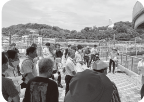
説明を受けてクリーン作戦開始