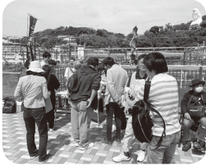
『クリーンアップかまくら』受付風景