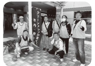
スタッフ7名で記念撮影