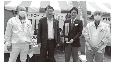
メーデー来賓の横浜市・山崎市長(右から2人目)