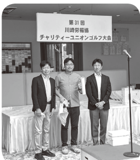
優勝者（中央）を表彰