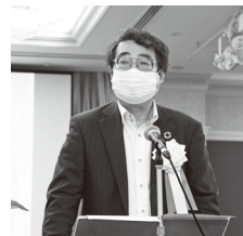
當具(とうぐ)会長挨拶

神奈川県生協連は、6月27日(火)ワークピア横浜にて第72回通常総会を開催しました。新型コロナの分類が2類から5類に移行し、今総会では総勢95名と、昨年より参加者が増える開催となり、すべての議案が賛成多数で可決されました。