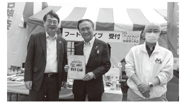
メーデー来賓の神奈川県・黒岩知事(中央)

URL http://www.fb-kanagawa.com Facebook で最新ニュースをアップしています。