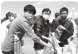
食材を届けていただいた参加者