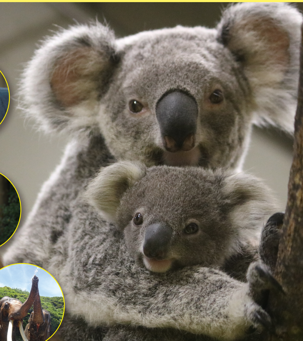
横浜市立金沢動物園の「コアラ」の親子