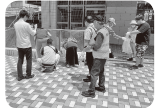
たくさんのゴミを回収

最後は鎌倉市の方とゴミ分別のお手伝いを行い、11時20分ごろにスタッフ7名で記念撮影終了しました。