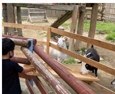
ヤギさんのおやつタイム

ヤギなどの家畜がいる広場です。毎日、11:00～11:10、13:30～13:40にはおやつタイムがあり、ヤギにエサをあげることができます（先着20組）。また、ポニーも間近で見ることができる楽しい広場です。