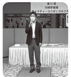
総括挨拶をする副会長

な協力をいただく一方で、開催目的でもある「チャリティ金」も最終ショートホールを「愛のホール」と位置づけながら、毎年実施する福祉施設への寄贈活動の浄財となるチャリティ金を募り99,704円という大きなご協力をいただけてきました。天候にも恵まれ楽しいイベントとなりました。