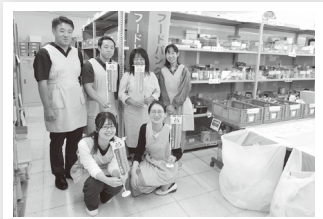
JAMかながわ（仕分け支援）