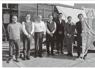
箱根登山鉄道労組（体験学習の実施）