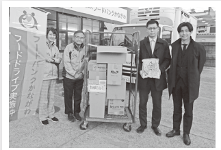
中地区教職員組合