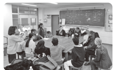
クリスマス会を開催しました

言葉が分からないということだけでなく、ちょっとした日常の習慣や考え方などから、学校での学習につまづき、誰にも相談できずに日々を過ごすなどということも少なくありません。県中央労福協は、共に地域社会を担う一員として、これからも子どもたちへの支援を継続してまいりますので、よろしくお願いたします。(協賛団体 県中央地域連合)