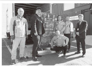
住友重機械労働組合連合会