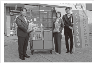
こくみん共済coop 神奈川推進本部