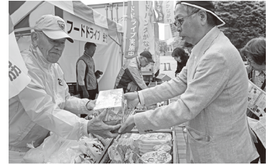
今年のフードドライブ活動

2026年メーデーにおいても、皆さまの取り組みが、大きな力となって社会に還元されます。ご理解・ご協力をお願いいたします。