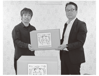
施設へのタオル寄贈

を持ち寄り、フードバンクかながわに寄付する活動です。2025年は2,610点1,046kgの食品がメーデー会場に届けられ、公益社団法人「フードバンクかながわ」を通じて、生活困窮者支援を行う自治体などをはじめ福祉施設、子ども食堂、ひとり親世帯を支援するNPOなどに寄贈しました。