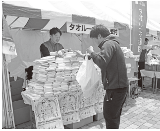
今年のタオル一本運動

未使用のタオルを集め、介護施設や児童養護施設などに寄贈し、社会貢献をする「タオル一本運動」は2025年で10年目を迎えました。昨年9か所のメーデー会場において、組合員、ご家族、労働組合、企業などの皆様から6,606本のタオルを集めることができました。