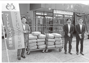
化学総連神奈川支連