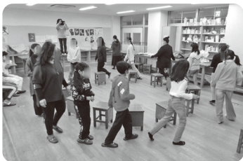
遊びながら言葉の勉強

働き手不足が叫ばれている中、県央エリアでは外国籍の人口が増加傾向にあります。県中央労福協は、地域で活動するNPO (Ed.ベンチャー) と2013年より協働して外国籍または外国にルーツを持つ子どもたちの学習と家庭の支援に取り組み13年が経過しました。現在では、卒業したこどもたちの一部はこの教室に戻り教える立場として活躍しています。今回は新たな取り組みにチャレンジしました。ひとつは、こどもたち同士で遊びながら日本語を学ぶことです。滞日年数の浅い子どもへは、ゲームを学習の中心に据えてこどもたち同士で教え合い楽しみながら学習することができました。また、子どもたち