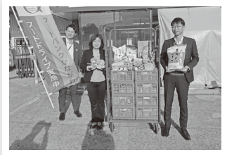
中央労働金庫 神奈川地区推進幹事全体集会

引き続き、神奈川県内の中核的フードバンクとして地域とのつながりを強め、役割を発揮したいと考えていますので、どうぞよろしくお願いいたします。